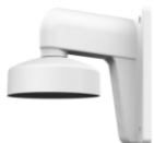
DS-1273ZJ-130-TRL Настенный кронштейн